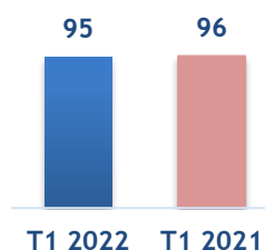
Compte Trimestriels En Million de DH

Au cours du premier trimestre, la CTM a enregistré un chiffre d'affaires de 95 millions de dirhams , en stagnation par rapport à la même période de 2021, et ce, malgré un début d'année 2022 marqué par les restrictions imposées du fait de la vague omicron.